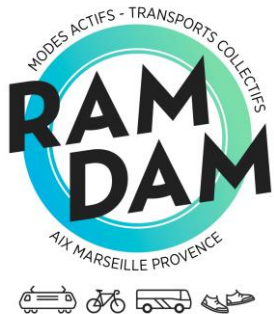
Table ronde n°3 Politique cyclable de la Région SUD : Intermodalité Vélo / Train