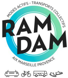
Table ronde n°3

Politique cyclable de la Région SUD : Intermodalité Vélo / Train